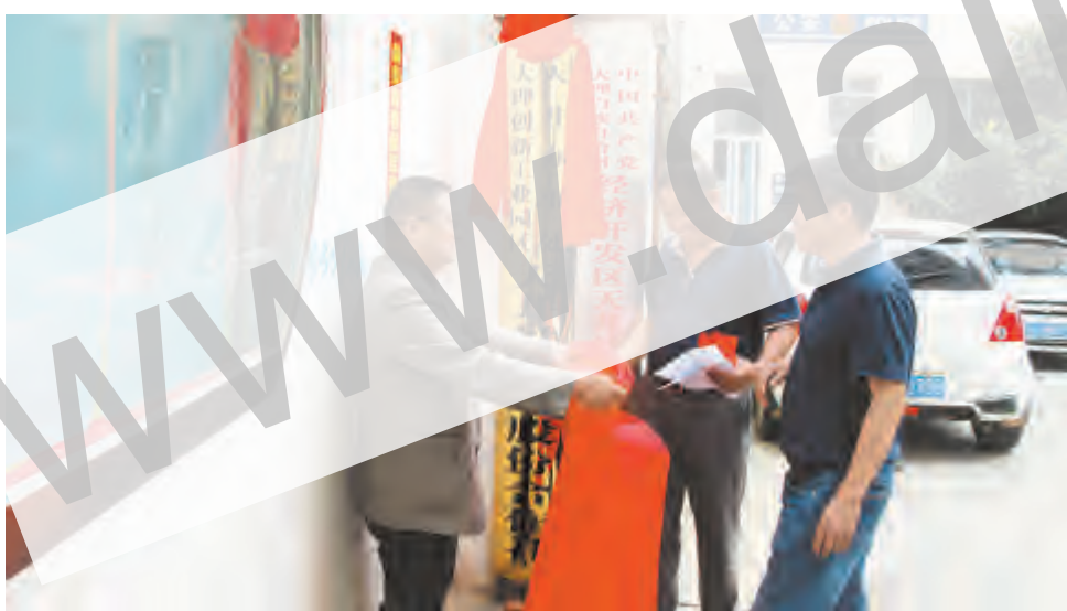
近日,天井办事处下属的西密、登龙、天井3个“村改居”社区资产股份合作社挂牌成立,完成了以保护农民集体经济组织成员权利为核心,以明晰农村集体产权归属、赋予农民更多财产权利为重点,确保集体经济发展成果惠及本集体所有成员的农村集体产权制度改革试点工作。