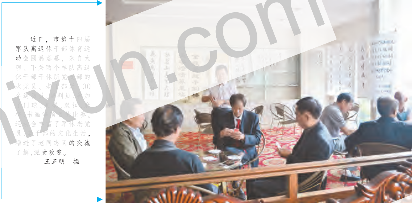
近日,市第十四届军队离退休干部体育运动会圆满落幕,来自大理、下关两个军队离退休干部休所党支部的老党员、老干部100多名运动员、裁判员,如门球、乒乓球、双扣牌、书画等项目的比赛。运动会丰富了军休老党员的干部的文化生活,增进了老同志间的交流了解,深受欢迎。

镇向阳溪村白文学校等,大力培养非物质文化遗产代表性传承人,打造民族文化传播及培训基地,依法保障少数民族的正当权益,深入开展民族团结进步创建“七进”活动,健全民族工作机制和民族团结目标管理制度,民族地区群众的生产生活条件得到较大改善,涌现出下关镇万花社区等一批民族团结进步示范单位,全市民族团结进步事业全面发展,宗教和顺局面得到巩固加强。周应良