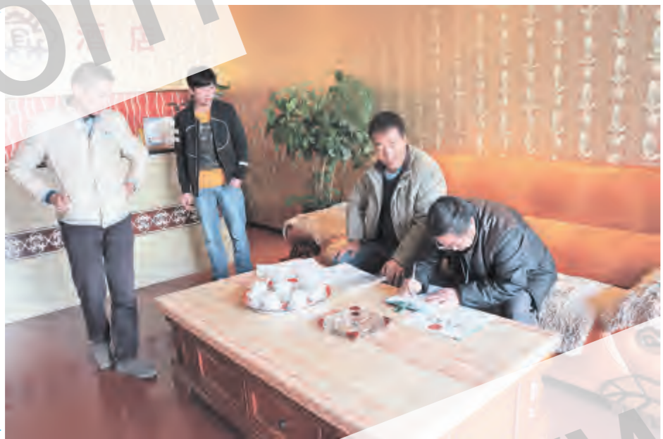
进一步加强洱海流域环境保护,严格落实洱海流域网格化管理责任制,近日,龙溪社区认真组织开展洱海流域住宿、餐饮等行业基本情况信息采集工作。