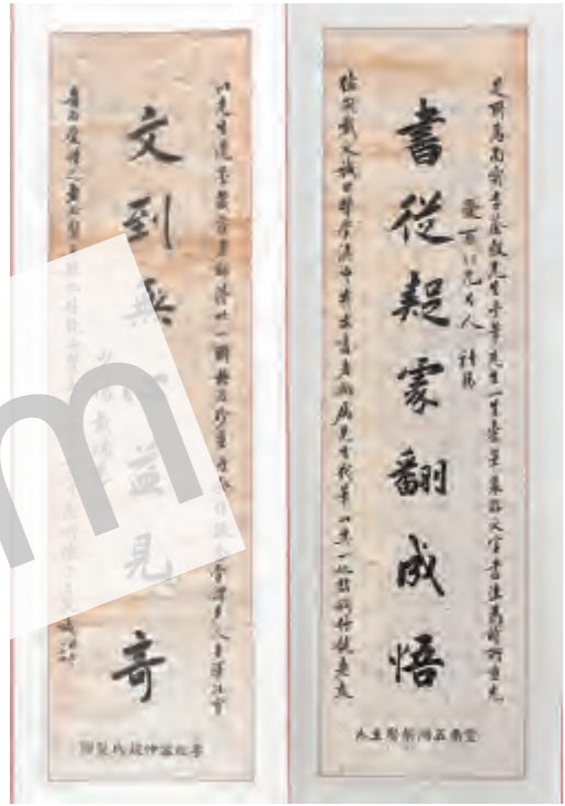
戴鸿慈 行书 对联 陈荣昌跋 清末 纸本 117*32cm

戴鸿慈(1853~1910年),字光耀,号少怀,晚号毅庵,广东南海人。光绪二年丙子(1876年)二甲四名进士,散馆授编修。历任山东、云南学政,侍读学士,刑、户、礼部侍郎。能书画。著有《出使九国日记》。跋为清末云南昆明进士陈荣昌书写。