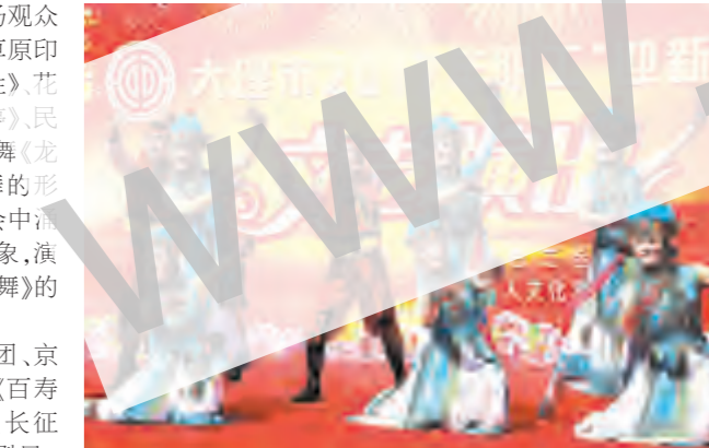
我市职工“迎新春”文艺演出现场。