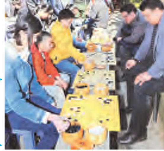
我市职工“迎新春”文艺演出现场。