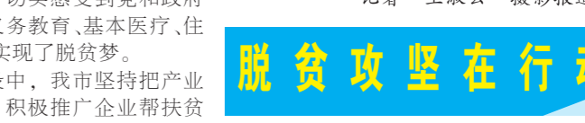
脱贫攻坚在行动的标语。