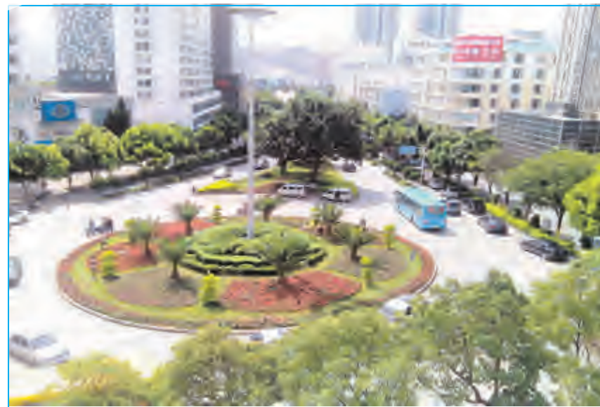
大理海关绿地提升改造工程