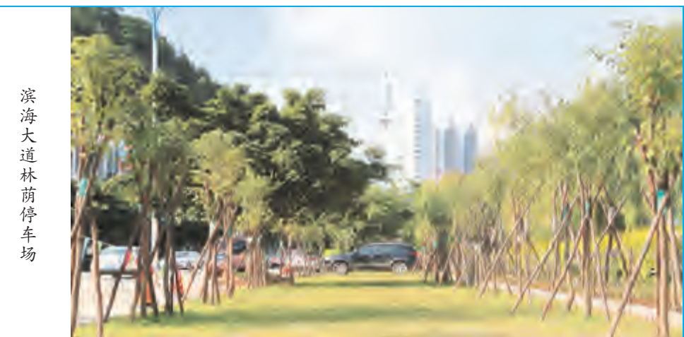
滨海大道林荫停车场