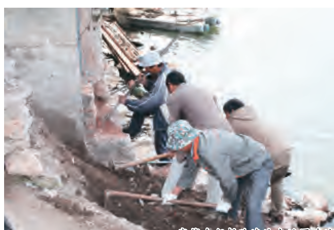
客栈自行拆除违法占滩违建地基