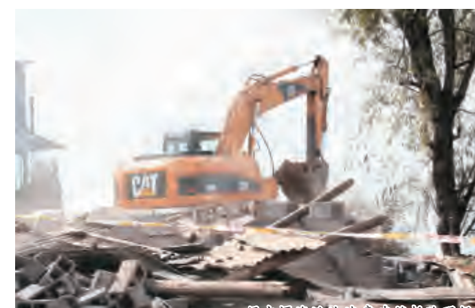
侵占洱海滩地违章建筑拆除现场

12月9日，伴随着大型挖掘机的阵阵轰鸣声，双廊镇洱海滩地上一处违章建筑变成一片废墟，被3间空心砖瓦房侵占的洱海滩地渐渐露出了原貌。这是我市对双廊镇43户违法侵占洱海滩地和水面行为进行集中整治中的一幕。近年来，随着洱海生态环境和交通条件的改善，环洱海旅游经济持续升温，部分群众为了眼前利益，在洱海湖滨滩地建盖违章建筑、违法占地、私搭乱建等破坏环洱海环境违法行为，强制拆除违章建筑和违法占地设施，进一步加强洱海生态环境监督管理，恢复洱海滩地，有效保护洱海生态环境。此次被强制执行的43户农户及客栈在双廊镇辖区内违法侵占洱海滩地和水面，同时未办理任何土地、规划、环保等行政审批手续，属违法违规占滩填海行为。在前期开展违法占滩情况排查和下达《行政处罚事先告知书》、《行政处罚决定书》的基础上，12月9日，洱海保护管理局和双廊镇开始对43户的违章建筑、违法占用土地和水面设施进行依法拆除，进一步恢复洱海滩地和水面，强化沿湖滩地管理，保护洱海生态环境。记者在现场看到，违章建筑、违法占用土地和水面设施的拆除工作进行得有条不紊。拆除过程中，执法人员还不失时机地对周围群众进行法律、法规宣传教育，做到执法、宣传相结合，标本兼治、综合治理，促进执法管理的规范化、制度化、科学化，为今后严厉打击洱海环境违法行为、有效保护洱海生态环境奠定了基础。