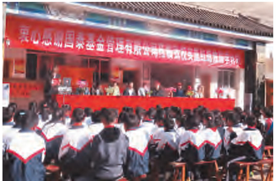
10月20日,挖色镇康廊完小师生迎来了一群特殊的客人——国泰基金有限公司红蜡烛助教队。带着对师生的真挚感情,国泰基金红蜡烛助教队为康廊完小的学生捐赠了电子设备、图书、学习用具以及生活用品等,总计180114元,并鼓励同学们再接再厉,争取做对社会有用的人。