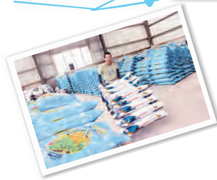
“洱海流域畜禽养殖污染治理与资源化工程”稳步推进

面对经济发展与环境治理同步进行的难题,历届州、市党委、政府高度重视,坚持走生态发展之路,始终把洱海保护作为滇西中心城市建设的前提和基础,把洱海保护治理放在经济社会发展与自然相协调的突出位置,洱海保护治理工作取得了阶段性成果,特别是在畜禽养殖污染治理方面取得明显效果。同时,资源化工程建设的稳步推进让洱海流域的面源污染治理成为现实。