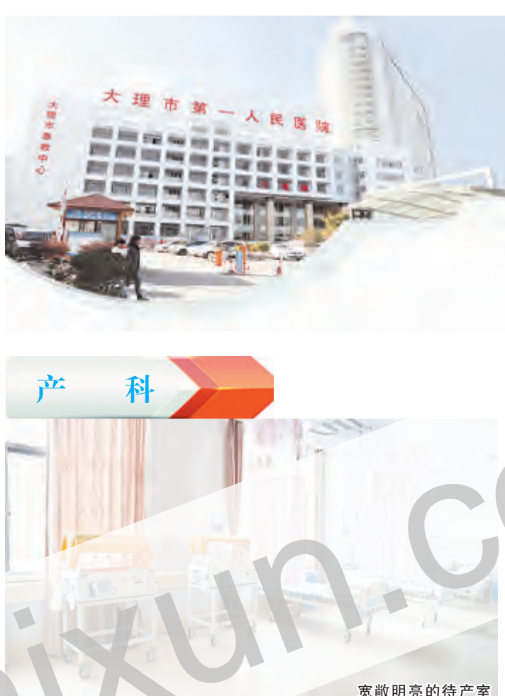
宽敞明亮的待产室

大理市第一人民医院产科1995年被国家卫生部授予“国家级爱婴医院”称号,2015年12月,再次通过了国家卫生计生委对爱婴医院的复核。为满足社会发展的需求,2011年初,产科从妇产科中分科出来,成立了独立的产科专科病区。产科现开放床位46张,设置有温馨病房,病区环境优雅,日常生活设施齐全,为产妇提供了优越的住院和修养场所。科室拥有一批经验丰富、责任心强、专业素质高的医疗技术力量,有医护人员40名,其中专科医师12名(主任医师2名,副主任医师4名,主治医师5名),专科护士28名(副主任护师1名,主管护师7名)。科室配置有多功能自动手术床、胎心监护仪、新生儿红外线辐射台、新生儿暖箱、标准新生儿沐浴间、多参数心电监护仪等先进的医疗设备和仪器。