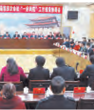
市政协八届四次会议「一府两院」工作报告协商会