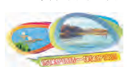
李锦芳 黑毅鹤 赵子忠

务以及涉及乡镇政府主要领导为成员的领导小组,领导小组在市农业局下设办公室。工作开展过程中,领导小组办公室定期不定期深入涉及乡镇检查指导工作,推进落实情况,及时协调解决工作中出现的问题。目前,大理市已完成每个库塘的产权归属、承包经营情况登记等工作。赵毅斌说:“一处优质水源,就是一座生态宝库。我们相信,通过清退库塘工作的开展,洱海流域的生态环境质量会不断改善,入湖水水质也会得到提升。”