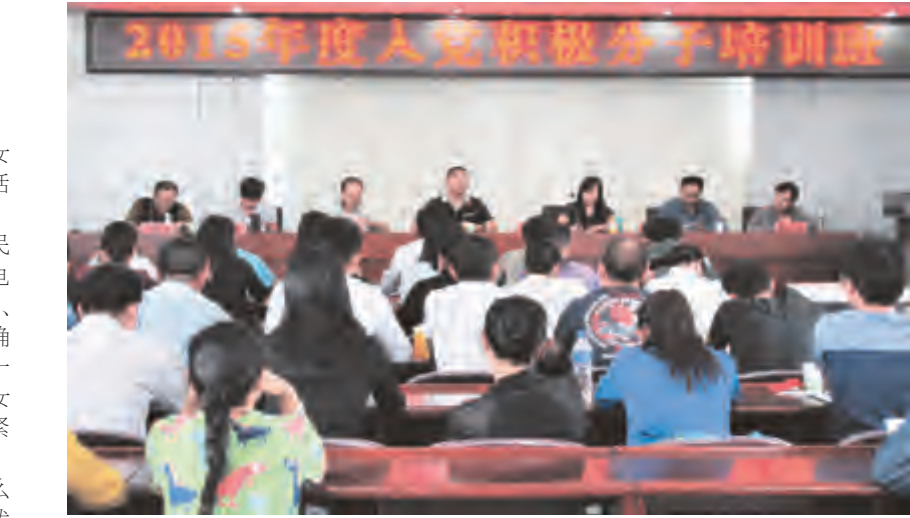
为进一步加强党员后备队伍建设,提高入党积极分子的理论水平和政治素质,确保新发展党员的质量,近日,市卫生局、市粮食局、市供销社、市交通局、市文体广电局、市人社局等6个单位党委联合举办2015年度入党积极分子培训班。

目前,公安机关已进行立案侦查。经民警调查,不法分子通过非法途径获取了当事人的个人信息,冒充有关单位工作人员,谎称有所谓的生育补助金要发放给当事人,然后再诱骗当事人至ATM机上进行操作,其实是将当事人的钱转入骗子的账户。市民遇到这类电话要多问问,多咨询,谨防上当受骗。 李玉琼