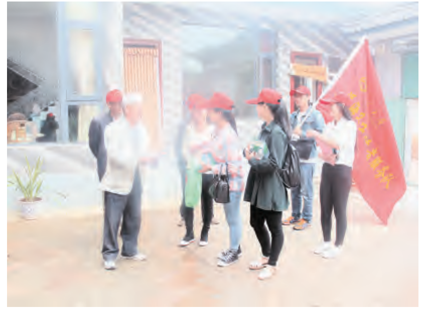
随着洱海保护宣传及各项工作的不断加强,“洱海清、大理兴”的理念日益深入人心,我市各级各部门和广大干部群众牢记习近平总书记“希望水更干净清澈”的殷切嘱托,牢固树立生态文明理念,形成像保护眼睛一样保护洱海的强大合力。图为大理大学洱海卫士志愿者在喜洲镇永兴村委员会上兴庄村向村民宣传洱海保护知识。

6月15日,州市卫生局、州卫生监督局、市卫生监督所、市疾控中心等部门在下属人民公园联合开展食品安全宣传周活动,拉开了2015年食品安全宣传周主题活动的帷幕。今年全国食品安全宣传周的主题是“尚德守法、全面提升食品安全法治化水平”。相关部门紧紧围绕主题,组织开展形式多样的“食品安全与公众健康知识”进社区、进校园、进公共场所等宣传活动,引导食品企业及从业人员学法、知法、守法、用法,强化主体责任意识,促进监管部门与生产企业熟悉、执行好标准;普及食品安全科学知识。工作人员向群众宣传常见致病菌性微生物、有毒动植物、毒蘑菇等导致的食源性疾病预防知识,重点防范病从口入,吃得安全、吃得健康;向市民解读宣传食品安全标准,提高对食品安全知识的认识和理解;解答群众疑问和咨询,体现科学性、权威性,引导社会各界积极参与食品安全普法宣传,增强社会监督意识,提高维权能力和科学素养,营造浓厚的食品安全社会氛围。此次食品安全宣传活动共出动人员89人次,车辆14辆次,发放《卫生监督知识读本》2万余册、《食品安全知识读本》300册、食品安全宣传资料1.2万份,展示食品安全知识展板12块,收到较好的宣传效果。王淑云 叶海霞