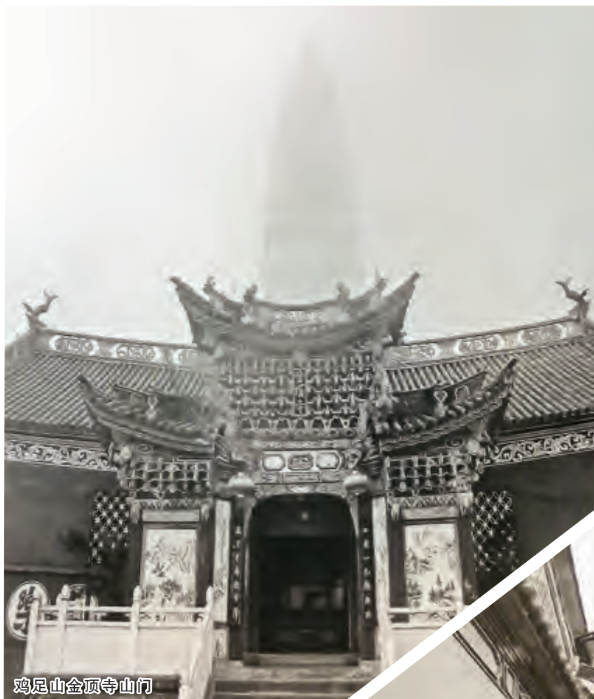
鸡足山金顶寺山门

从下定决心到坚持不懈的寻找、拍摄,27年的辛劳结成硕果。经过后期的选择、制作、编辑,一册图文并茂、装帧典雅,544页的《大理老门楼》,于2014年6月由云南人民出版社出版。