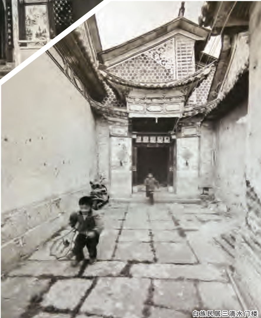
白族民居三滴水门楼

倾圮或被人人为地摧毁,“令人伤心,国人多熟视无睹”,原因在于“缺乏视建筑为文物遗产之认识,官员均少爱护旧建的热心。”他知道个人“无力阻挡破坏旧建的狂潮”,指出:“以测量绘图、摄影各法,将各种典型建筑实物作有系统秩序的纪录是必须速做的。因为古物的命运在危险中,调查同破坏力量正好好像在竞赛。”这项工作“可以作学术研究,一方面促进社会保护。”