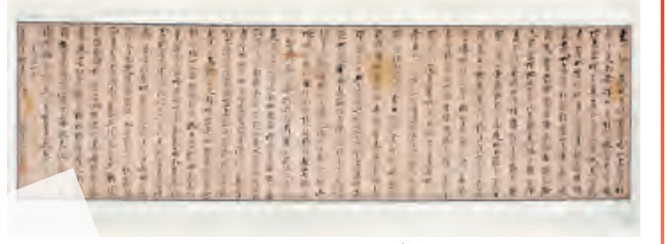
沙琛 行书 横幅 清中期 纸本 30.5*137cm

沙琛(1759—1821年),字献如,号雪湖,回族,云南太和(大理)人,乾隆庚子年科(1780年)举人。历官安徽怀远、怀宁、建德、霍邱等县知事。善草书,学孙过庭,有奇趣。著有《点苍山人诗钞》、《续台纪恩》等集。