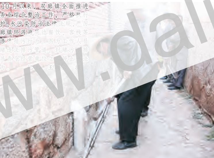
自10月以来,双廊镇全面推进“旅游服务业综合整治工作,严格执行环境保护、水污染防治法律法规,严厉打击双廊镇洱海周边餐饮、客栈等服务业违法排污行为。图为工作人员拆除洱海违法排污管道,封堵排污出口,并责令经营单位立即停止违法排污行为。