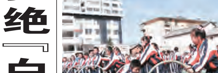
明媚的阳光下,做课间操的孩子们动作协调舒展;五颜六色的彩球在孩子们手中飞舞出美丽的弧线;玩游戏的孩子门灵活地闪躲、过人;优美的华尔兹集体舞让孩子们绅士十足;《弟子规》通过

文化生活的开展,让孩子们稚嫩的心声说唱着;一曲《感恩的心》伴随着孩子们的手语操在校园里回荡……每天的体育大课间时间,这样一幕幕精彩的画面都会在下关一小的校园里上演,师生们的运动激情和欢声笑语,让操场变成了欢乐的海洋,也让“阳光体育大课间”活动成为了下关一小校园中的一道亮丽风景。