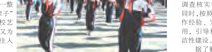
活动中,下关一小首先将第三套小学生广播体操《七彩阳光》作为学生的热身活动。紧接着,让孩子“与圣贤为友,与经典为伴”,开始说唱《弟子规》,实现了传统文化、艺术和体育运动的有机整合,为孩子的幸福人生奠定坚实的道德基础。第三部分是《韵律操》,此套由下关一小马雪老师自编自创的韵律操讲究的是“舞动起来,快乐向前冲”,充分体现了“我运动,我健康,我参与,我快乐”的体育大课间理念。第四部分是各年级《特色体育运动》,通过一年级的《找朋友》游戏;二年级的套圈竞技;三年级的集体舞,四五六级的球操等趣味体育,给孩子们更广阔的天空,实现了多元发展,张扬个性,小场地的大利用。活动最后以手语操《感恩的心》进行放松整理,让孩子们跟随音乐,舒展身体,放松心情,做一次身体和心灵的阳光之旅。

为儿童生命奠基,让阳光普照童年。如今下关一小已将大课间活动升华为体育文化,孩子们在碧澄的蓝天下,享受着幸福完美的教育生活。