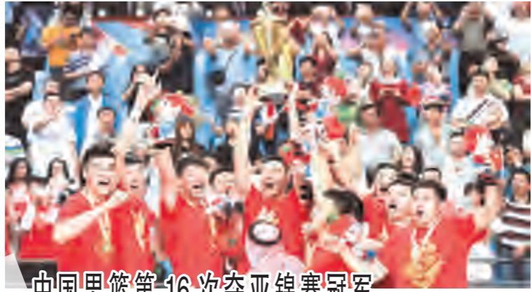
中国男篮第16次夺亚锦赛冠军