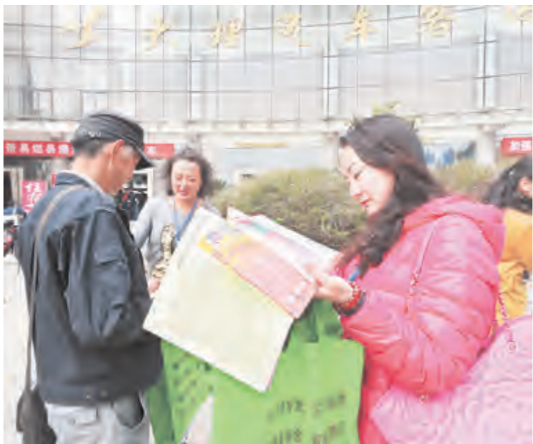
3月28日,榆华社区科协在客运北站开展“文明祭祀平安清明”宣传活动,发放宣传资料500多份,提倡居民进行文明祭祀活动,用文明行动纪念先人,共同营造平安、文明的祭祀氛围。

银桥镇要求各相关部门和人员要按照工作部署,认真做好村民健康体检、HIV筛查及艾滋病综合防治工作。一是制定筛查工作方案。对全镇16岁以上的常住人口进行艾滋病筛查,计划筛查2.3万人,投入资金预计为27.6万元。二是扩大宣传,开展镇、村、组三级业务培训会。深入各村开展艾滋病防治宣传,做到宣传资料进村入户,人人知晓。三是开展学校艾滋病防治工作,初中及以上学校全面开展艾滋病防治宣传课程。四是扩大孕产期检测,做好母婴阻断工作,同时做好职业暴露的预防和处置工作。五是加强自愿咨询检测工作,做好自愿咨询检测宣传和转介工作。六是加强随访管理,严格执行药品发放登记,确保随访管理记录及时上传。七是做好初筛阳性告知、流行病学调查和样本采集工作,确保初筛阳性病例不流失。八是规范性病诊断报告,提高性病诊断报告符合率。