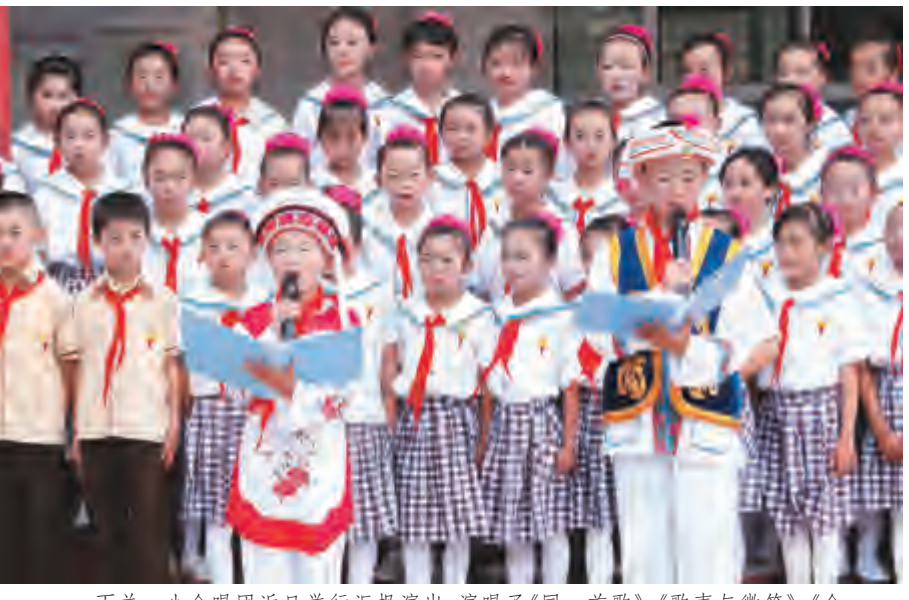
下关一小合唱团近日举行汇报演出,演唱了《同一首歌》、《歌声与微笑》、《金孔雀飞过大地》、《茉莉花》等歌曲,得到了现场老师和同学们的好评。此次活动的举行丰富了学生的课余生活,展示了下关一小实施素质教育的成果,进一步营造了和谐向上的校园文化氛围。

近日,市教育局组织开展2014—2015学年中小学课堂教学竞赛,进一步推进新一轮基础教育课程改革,引导广大教师深入领会高效课堂的基本内涵,转变教学方式,提高中青年教育者教学水平,促进教师的专业成长和学生的全面发展。此次活动以“片区教研,为教师的专业成长搭建平台”为主题,参赛科目主要有高三英语、初中九年级政治和小学四、五年级数学三个科目,并由大理学院、辖区各高中学校的专家、州、市专兼职教研员、名师讲学团成员及骨干教師担任评委,相应学科的教师在决赛期间参加观摩,多媒体辅助教学、师生互动、高效教学、现场点评是此次活动的最大特点。据了解,此次活动采用课堂教学竞赛的方式,分预赛和决赛两个阶段进行,全市共举办23场预决赛,近200名教师参赛,在各学校、片区组织预赛的基础上,推选出的优秀选手在11月参加全市决赛,达到以赛促教、以赛促研、以赛选优、以赛促学的目的,推动以校为本教研工作开展,在培养具有创新思维能力、学科知识拓展能力、信息技术运用能力和教育科研能力的中青年骨干教师方面发挥了重要作用。 记者 杨辉