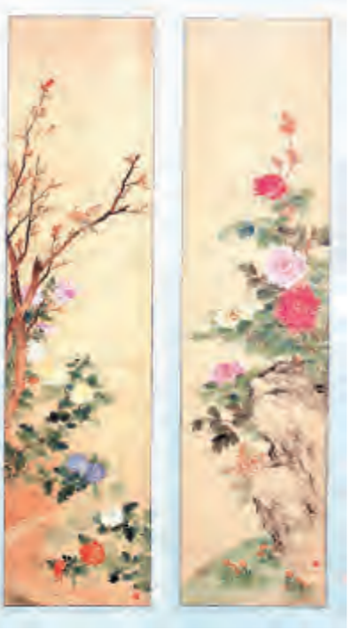
周其淳 花鸟图 四条屏之二 清中期 绢本设色 202x48cm

周其淳,字石屋,生卒不详,约活动于清乾、嘉时期。擅花鸟鱼虫,作设色花卉尤精。师法徐熙、黄筌,曾被云南学使顾莛推为画工第一。(资料由大理市博物馆提供)