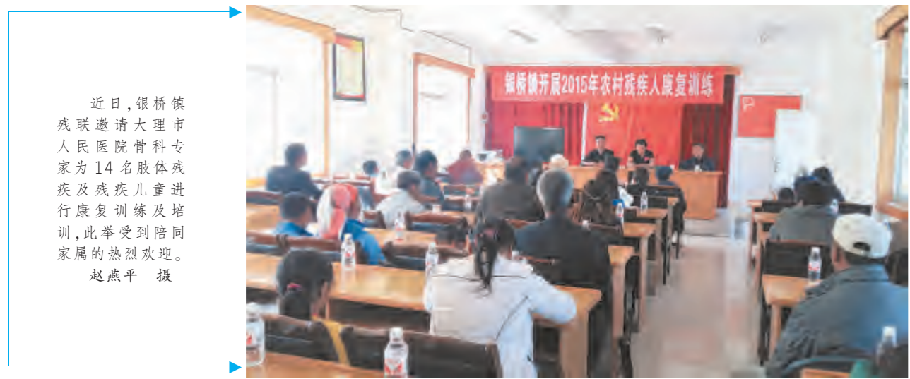
近日,银桥镇残联邀请大理市人民医院骨科专家为14名肢体残疾及残疾儿童进行康复训练及培训,此举受到陪同家属的热烈欢迎。