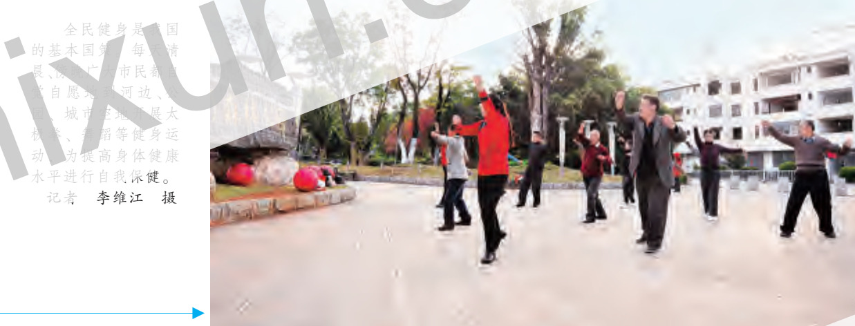
全民健身是国民的基本国策。每清晨,大理市民都自觉自愿地参加各种健身运动,为提高身体健康水平进行自我保健。