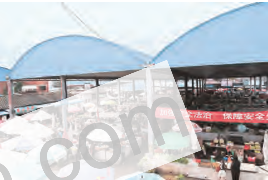
凤仪供销合作社员工在凤仪市场进行志愿服务。

让职工分享企业发展成果,是职工的呼声,也是企业发展的内在动力。“几年来,凤仪供销合作社有限责任公司未发生违反劳动保障法律法规的劳动争议案件,未发生因劳动关系纠纷引起的职工集体上访等群众事件。”企业负责人表示:“下一步,要让股东和员工形成合力闯市场,不断提高职工的收入水平,为社会提供更多的就业岗位,实现企业和职工‘双赢’目标。”我们也相信,凤仪供销合作社有限责任公司的步伐一定会更稳健,劳动关系会更和谐。(图为凤中市场一角)