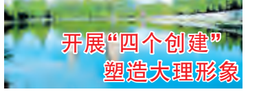
开展“四个创建” 塑造大理形象

在开展精神文明创建工作过程中,我市社区紧扣全国文明城市创建标准,以“服务百姓、造福社会”为目标,注重“一推进、八服务、一构建、一设立、三开展”,以精神文明创建工作促进其他工作不断提升,增强社区的活力、群众认同感和凝聚力。全力推进“四清四整四晒”工作机制向纵深发展,对居民家庭做到:逐户家访,知晓家庭经济状况,知晓家庭成员政治面貌,知晓家庭道德规范;逐户入户走访,做到:了解就业情况,帮助困难人员就业;逐户入户走访,做到:了解流动人口情况,帮助流动人口就业;逐户入户走访,做到:了解群众诉求,解决群众困难。开展“四个创建”活动,即创建“学习型”社区、创建“服务型”社区、创建“平安型”社区、创建“文明型”社区。通过创建活动,全面提升社区文明程度,增强居民的幸福感和归属感。开展“四个创建”活动,即创建“学习型”社区、创建“服务型”社区、创建“平安型”社区、创建“文明型”社区。通过创建活动,全面提升社区文明程度,增强居民的幸福感和归属感。