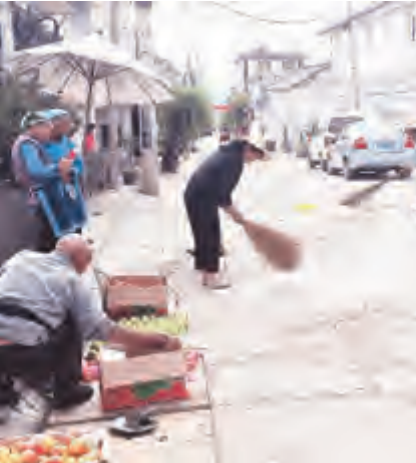
湾桥镇湾桥村保洁员正在清扫街道。

根据湾桥镇的相关要求,上阳溪村向村民发出倡议书,广泛宣传动员,做好大家的思想工作,支持垃圾定时定点清运工作。村里聘请了4名垃圾收处人员和一辆三轮车,在市镇补助的基础上,向村民每户每月收取3元的垃圾处理费,采取先试运行、后收费的方式,通过互相监督,让村民满意,再签订合同正式实施。经过一段时间的试运行,成效显著,村庄环境卫生明显改善,村民卫生意识得到提高,大家比较满意。