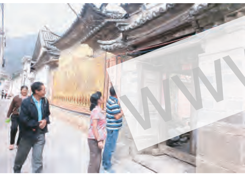
为让居民有一个安全的居住环境,近日,下关镇关莲社区结合网格化管理开展辖区危房排查工作,社区工作人员逐一走访了辖区每个区域,重点对老宅院进行了实地查看和排查,对存在隐患的楼房进行登记和拍照,并对存在安全隐患的房屋情况进行上报。