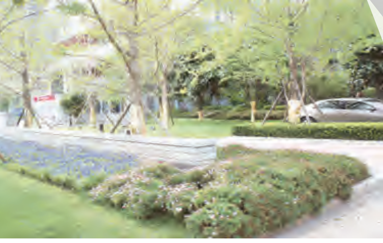
环洱海采访纪行系列报道21

湾桥镇云峰村位于苍山脚下，属于传统的水稻产区。近日，记者沿沿涌溪而上，在苍山脚下的田间地头看到另一番景象：大片的稻田已被核桃地取而代之，一株株核桃树枝繁叶茂，挂着重果，长势喜人。