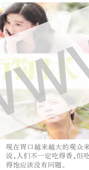
现在胃口越来越大的观众来说,人们不一定吃得香,但吃得饱应该没有问题。

为票房主力,如《闯入者》和《念》,但毕竟保证了市场类型丰富性。此外,梦工厂的《疯狂外星人》成为本月唯一靠谱的动画选择。国产青春、港味警匪、好莱坞的华丽,四月影市一应俱全, 全月共有超过 25 部电影登陆院线,对于