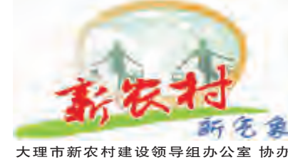
大理市新农村建设领导小组办公室 协办

文献自然村位于我市南片区,邻近大理经济开发区,西靠青光山,有3个村民小组,420户,1360人。现有的国有土地43亩向外承租经营,即现在的文献建材市场;山林面积约2000多亩均已均股到人,其中有1000多亩林地以流转方式承包给大理嘉逸文化旅游度假开发项目使用。村民经济收入主要靠房屋出租、外出打工及从事运输业、服务业等。2014年,在市镇党委、政府的关心支持下,文献自然村被列为市级美丽乡村建设示范村。经过多方整合资金,