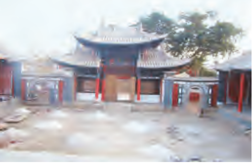
地址：大理市下关苍山路23号

南薰桥头，一沟油绿的豌豆苗苗间是当年的河道，常有老人的手指在河边走过，留下浅浅的印子：“就在这，红军和敌人干了一仗，拿下州城的时候，河水都被染红了。”南薰桥在州城南门外的钟良溪上，始建于明代的单孔石拱牌楼式风雨桥。传奇中的唱词，小旦的一截子水袖，南薰桥上有太多残缺的故事，时日一久便无迹可寻了。有时，“亲历”是个矜持的词，灰布绑腿八角帽、白柄红底的军旗、被鲜血染红的河水，是亲历者口中的故事，也是永世铭藏的记忆。时值今日，在州城宾兴楼的楼壁上仍能寻到文革时期的标语，“将无产阶级文化大革命进行到底”是我无法亲历、无法揣测的年代。在宾兴楼的东西两面分绘着毛主席画像，青灰的墙壁上仅存的黄绿是服色。亲历是矜持，州城是亲历者，携着可知可感的情愫。