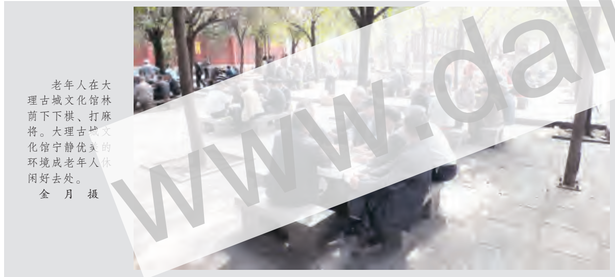
老年人在大理古城文化馆林荫下下棋、打麻将。大理古城文化馆宁静优美的环境成老年人休闲的好去处。

100米范围内禁止摆摊设点。生产加工小作坊和食品摊点从业人员必须取得健康证及符合相关行业的基本条件后,方能获得备案许可。目前,在市政府食品安全委员会的组织协调下,生产加工小作坊排查和食品摊贩排查整治各项工作正有序推进,全市已取缔临时摊点110多个。 董照明