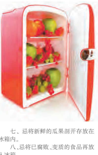
七、忌将新鲜的瓜果剖开存放在冰箱内。