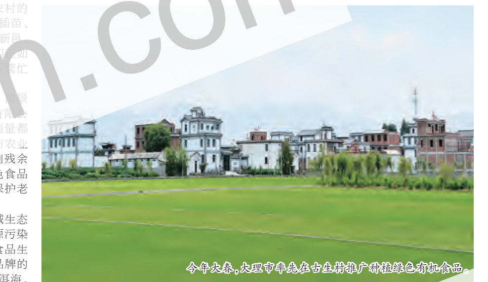
今年立春,大理市率先在古生村推广种植绿色有机食品。

春耕生产时节,穿行在大理市农村的田间地头、乡村小道,随处可见秧苗、备料施肥、修整清淤的身影。在银桥新县大理村绿色水稻种植基地,村民们如火如荼地忙着栽植水稻,呈现出一派繁忙景象。