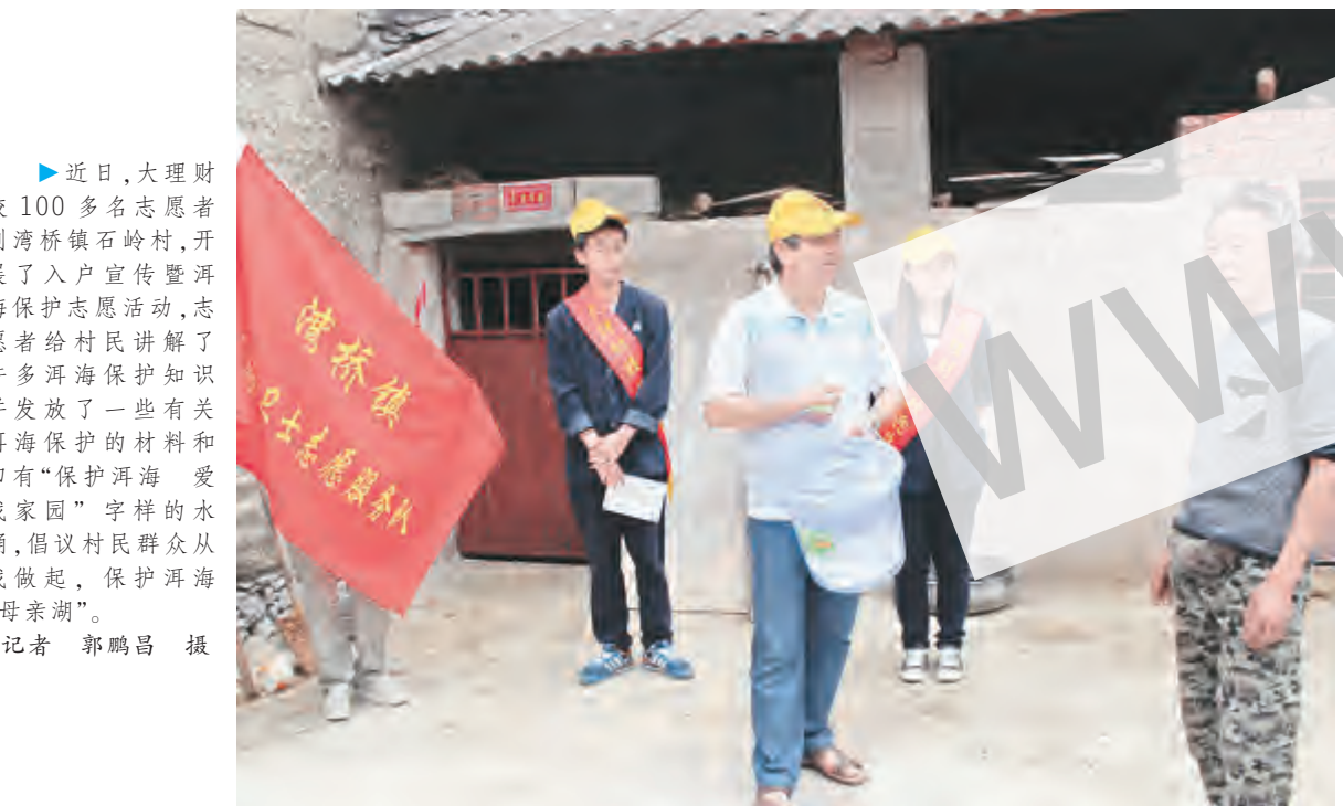
近日,大理财校100多名志愿者到湾桥镇石岭村,开展了入户宣传暨洱海保护志愿服务活动,志愿者给村民讲解了许多洱海保护知识并分发了一些有关洱海保护的图片和印有“保护洱海 爱我家园”字样的水桶,倡议村民群众从我做起,保护洱海“母亲湖”。