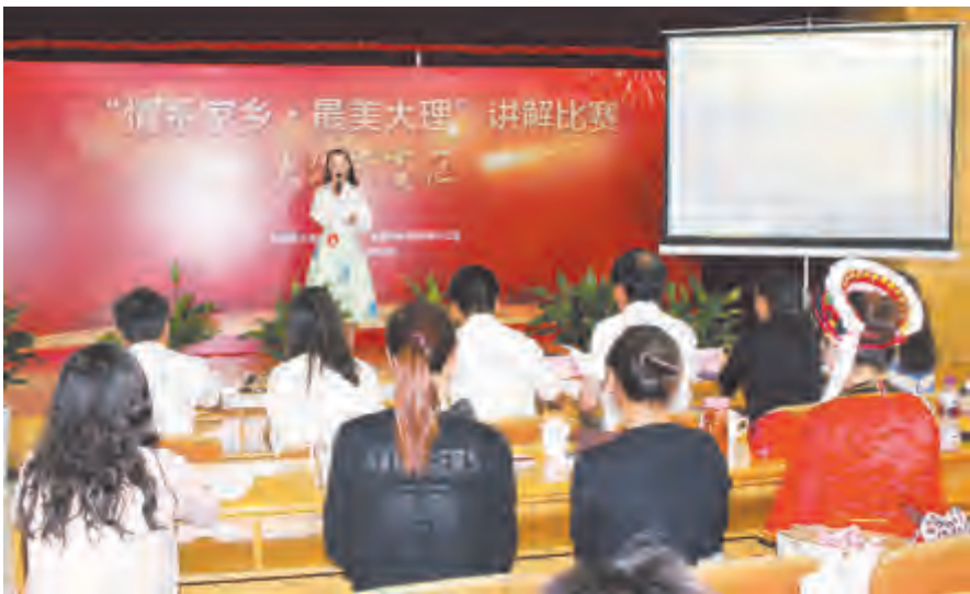
活动通过以赛促训的形式,激励广大职工热爱大理、宣传大理,并通过才艺展示、开展交流,发现优秀讲解人才。

比赛分形象展示环节和个人讲解两部分内容。在形象展示环节当中,参赛选手以最简洁、最流畅的方式作自我介绍,力争给评委和观众留下深刻印象。在个人讲解的环节中,选手们紧扣主题,有的以演讲方式,有的以诗歌朗诵方式,对家乡大理的新变化、新成就进行了精彩解说,博得观众阵阵掌声。还有的选手通过多媒体课件展示配以声情并茂的讲解,向大家呈现出一幅充满生机、活力、魅力、实力的大理辉煌的气势和宜居宜人的生态人文景观。讲解比赛中,选手们把一幅幅家乡美景,以及大理的新变化,用精彩的演讲诠释了出来。