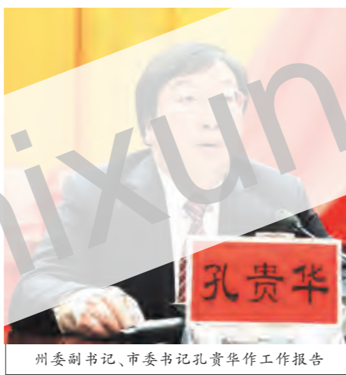
州委副书记、市委书记孔贵华作工作报告

孔贵华代表市委常委会作工作报告并就“十三五”规划建议作说明 高志宏总结部署经济工作