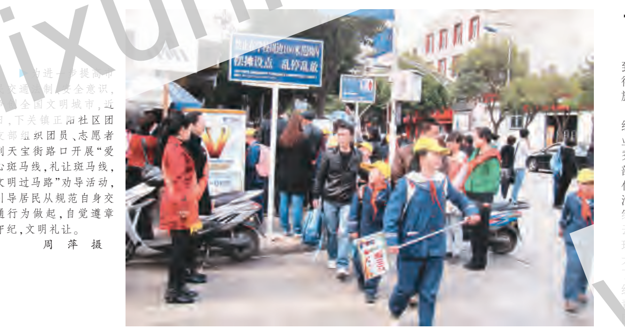
为进一步提高市民交通安全意识,争创全国文明城市,近日,下关镇正阳社区团支部组织团员、志愿者到天宝街路口开展“爱心斑马线,礼让斑马线,文明过马路”劝导活动,引导居民从规范自身交通行为做起,自觉遵章守纪,文明礼让。

为全面掌握全市各乡镇村单独家庭基本信息,市计生局于今年初组织计生专干进村入户,对符合“单独两孩”生育政策对象开展调查摸底,建立工作台账,做到底数清、情况明、档案全,为顺利启动实施“单独两孩”政策做好衔接准备。经初步摸底调查,全市共有符合“单独两孩”生育政策的夫妇1571对。 宣传培训到位。利用大理电视台“人与家栏目”、《大理时讯》、市电视台、大理人民广播电台等媒体及时发布云南省实施“单独两孩”相关政策,印发政策解读宣传材料5000多份,让广大群众及时准确地了解新政策的重大意义,适用对象、审批手续等。4月初,市计生局派出工作人员到昆明参加云南省计生委举办的“单独两孩”政策培训班;并及时召开了全市计生办主任培训会,并要求“两区”、各乡镇(镇)办、村(居)计生人员进行培训。通过层层宣传培训,规范了全市计生专干对“单独两孩”政策衔接、办证所需条件、材料和办证程序等的认识,进一步提升了计生专干政策水平和服务能力。 服务群众到位。为全面优化办事程序,提高工作效率,在乡镇(镇)办、村(居)计生专干政策水平、服务能力、服务态度、公示“单独两孩”办证条件、程序及