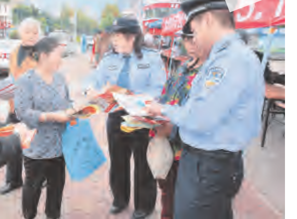
记者 陈曙娟 摄影报道

宣传材料、介绍假冒伪劣商品鉴别方法等方式, 揭露各类经济犯罪作案手法, 提醒群众对传销、非法集资、银行卡犯罪、虚假信息诈骗、利用假币等常见多发的经济犯罪加强防范, 增强维护资金和信息安全的能力。宣传活动展示了公安机关打击经济犯罪的成果, 营造了打击和防范经济犯罪的良好社会氛围。