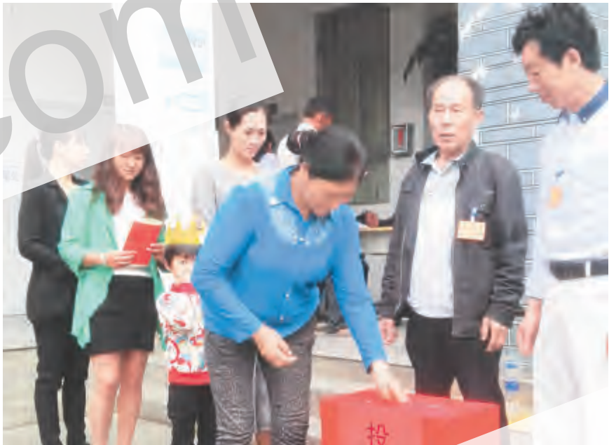
为确保村民委员会换届选举工作顺利推进,下关镇把村党支部换届选举工作作为推进基层组织和民主政治建设的重大任务,严格程序,依法选举。5月15日,下关镇在各个村委会设立投票点,开展村民委员会换届选举投票工作,村民们积极投票,选举自己信任的“当家人”。