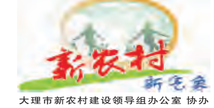
大理市新农村建设领导小组办公室 协办

通过参观,使我对新农村建设有了更深刻的认识,我认为在建设社会主义新农村中应强化四种意识:一是谋划意识。建设新农村,不能够短打算,而需长远谋划。二是亲民意识。不能以运动的方式搞建设,而是要切实从维护广大群众的切身利益考虑,不包办代替,不层层加码压指标,不相互攀比搞速度,否则,就不是造福群众。三是责任意识。从紧迫的事做起,从群众最关心的事做起,防止蛮干、急于求成。四是全面意识。新农村建设作为一项系统工程,它的各项内容紧密相联,因此要完整地予以规划。只有强化了这四种意识,才能真正把社会主义新农村建设的各项任务落到实处,才能真正为群众办实事好事。