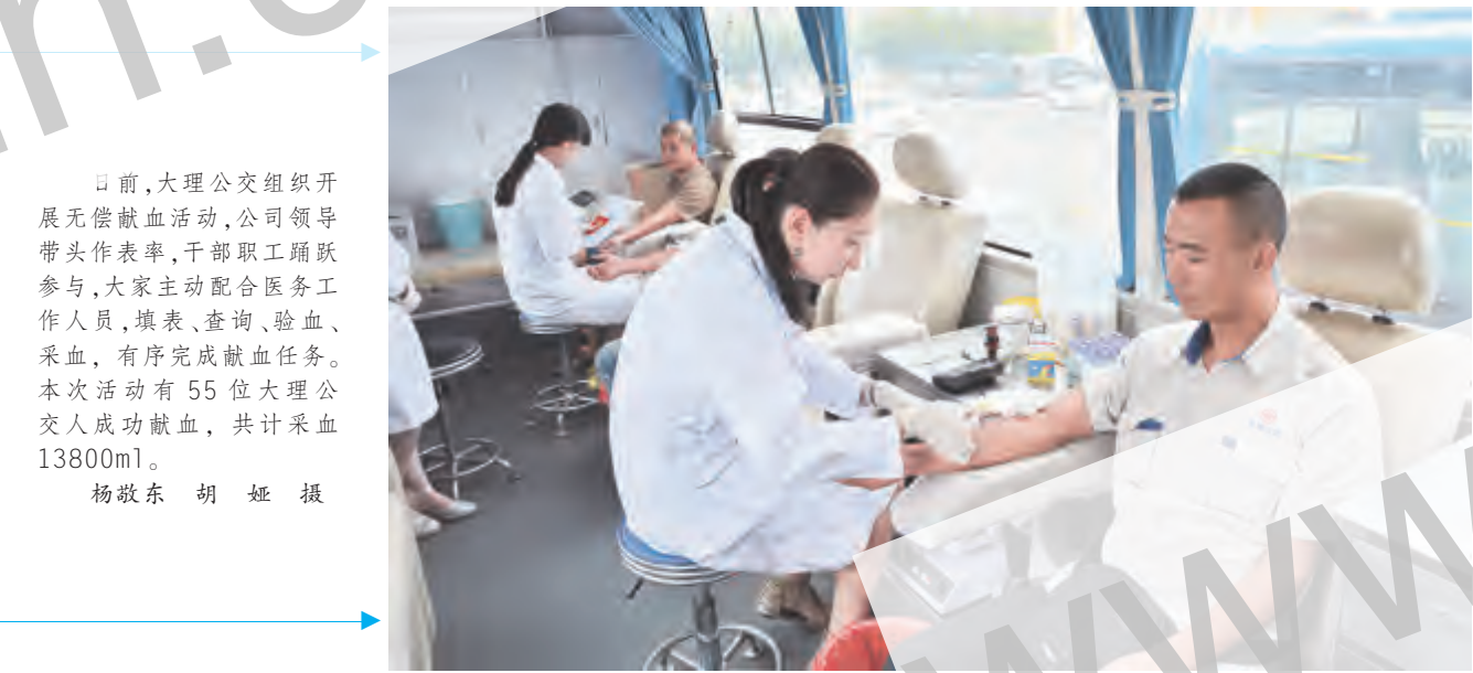
日前,大理公交组织开展无偿献血活动,公司领导带头表率,干部职工踊跃参与,大家主动配合医务工作人员,填表、查询、验血、采血,有序完成献血任务。本次活动有55位大理公交人成功献血,共计采血13800ml。

市粮食局党委开展集体廉政提醒谈话 7月24日,市粮食局党委开展集体廉政提醒谈话活动,局党政领导班子成员、各党支部支部书记、国有企业领导班子成员、局机关科室负责人参加集体廉政提醒谈话活动。 会上,组织学习了州纪委通报的7起违反中央八项规定精神典型问题、省州粮食局关于在全省粮食局系统开展“廉洁粮食”建设活动的通知和大理市关于在“三严三实”和“忠诚干净担当”专题教育中深入治理“为官不为”问题的实施方案。 在集体廉政谈话中,党委书记董建国以“坚守个人干净这条底线”为主题,从三个方面强调了当前形势下加强反腐倡廉建设的重要性。一是始终保持对岗位责任的敬畏。二是始终保持对党纪国法的敬畏。三是始终保持对手中权利的敬畏。并要求每个同志都要保持清醒的头脑,要时刻绷紧廉政纪律的弦。活动最后,局领导班子成员和中层干部分别签订了廉政承诺书。参加谈话的同志都认为,通过廉政提醒谈话,大家在灵魂深处又受到了一次深深的触动和震撼,有效起到了预警促廉的作用。 赵亚凡