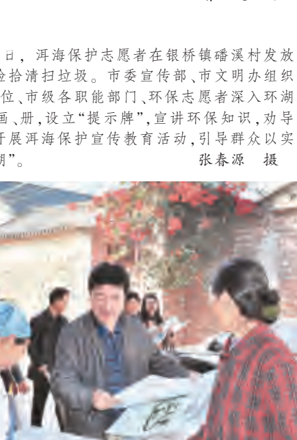
洱海保护志愿者在银桥镇福溪村发放洱海保护宣传画,捡拾清理垃圾。

全会精神与研究解决问题结合起来。围绕全会提出的一系列新思想、新观点、新论断和新要求,认真梳理当前大理市发展面临的一系列重大问题,精心做好市委八届四次全会各项筹备工作。