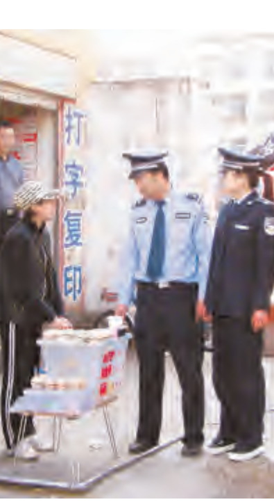
市城管局开展学校周边环境秩序整治

为营造良好的校园周边环境,日前,市城管局集中开展整治工作,规范占道经营、占道停车、占道施工和散发小广告、传单等违规行为,确保新学期校园周边环境整洁、秩序良好。3月1日以来,规范学校周边100米以内店外经营和流动摊点117起,查处占道停车30余起,劝导驶离150余起;查处违章占道施工2起、限期整改5起;查处散发小广告16起,清除非法喷涂、粘贴广告165张。