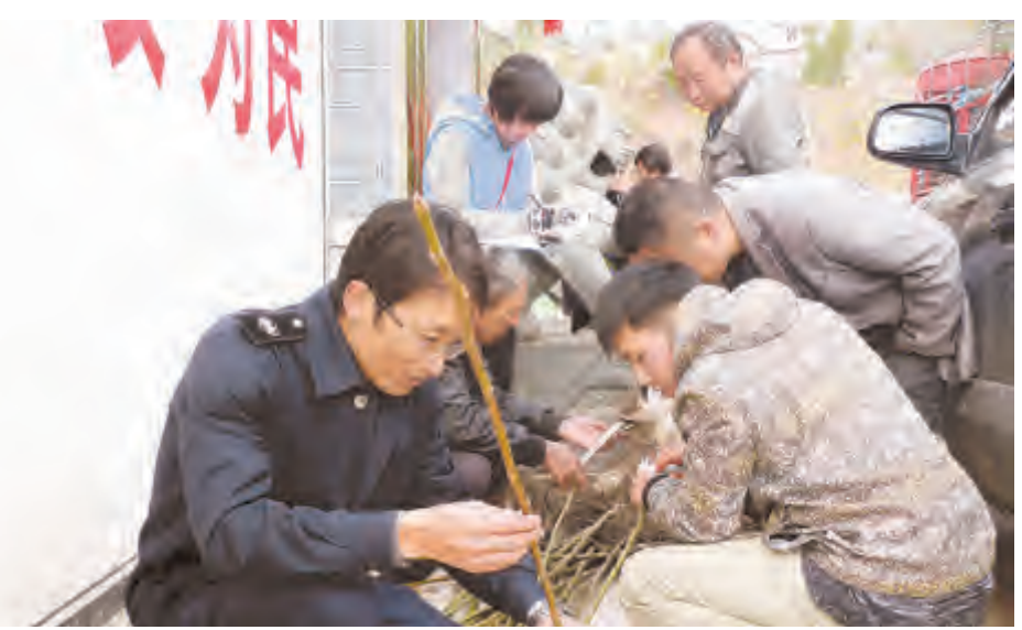
冬末春初,是植树造林的最佳时节,为了有效防止危险性林业有害生物传播蔓延,确保大理市森林资源安全,不断推动经济林产业持续健康稳定发展,市林检局切实加强核桃种苗的检疫工作。

中心医师就艾滋病防治“一站式服务”项目的工作要求、工作流程、市辖各抗病毒治疗机构的职责作详细讲解,指出转介治疗成功是整个项目成功的关键环节,要加强对大众及医院就诊者关于“早检测”和“及时治疗”的宣传,对所有新检测发现的艾滋病病毒感染者和病人,在两种不同