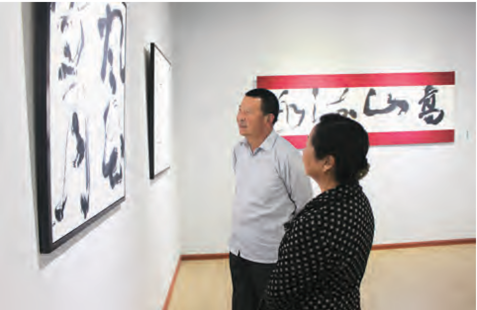
出生于大理州洱源县的军旅书法家赵月秋书法展于5月3日至29日在大理州图书馆举办。书法展的举办,丰富了三月街民族节日期间人民群众的文化生活。图为群众在认真参观和欣赏书法作品。