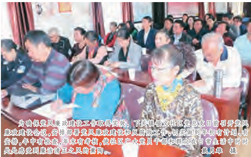
为确保持风廉政建设工作取得实效,下关镇福文社区党总支日前召开党风廉政建设工作会议,安排部署党风廉政建设和反腐败工作,切实做到年初有计划、有安排,年中有检查,年末有考核,使社区广大党员干部和群众在日常生活中时时处处感受风清气正之风的熏陶。

开展课题调研和提案是民主党派的重要工作,也是民主党派进行建言献策、积极参政议政的重要途径和手段。为做好2015年课题调研工作和提案工作,民建大理州委结合自身实际和特点,根据