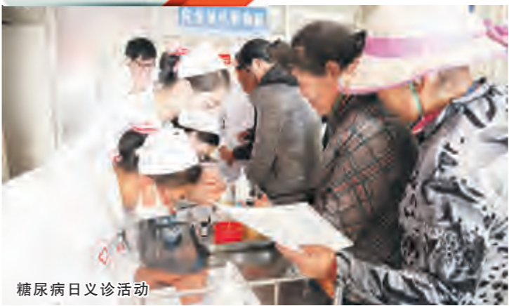
糖尿病日义诊活动

大理市第一人民医院内分泌代谢病科经过多年的建设发展,拥有一批学历高、技术精湛、经验丰富的高素质专业技术队伍。科室开放床位52张,有医护人员22名,其中,专科医师7名(主任医师1名,副主任医师2名,主治医师4名),专科护士15名。科室拥有快速血糖检测仪、糖化血红蛋白检测仪、免护瞳眼底照相机、胰岛素泵、尿微量蛋白检测仪、动态血糖监测仪、印迹杂交胰岛素自身抗体检测、糖尿病慢性并发症筛查评估、压力抗栓泵治疗仪、多普勒血流检测仪、三导联心电图仪等一批国内