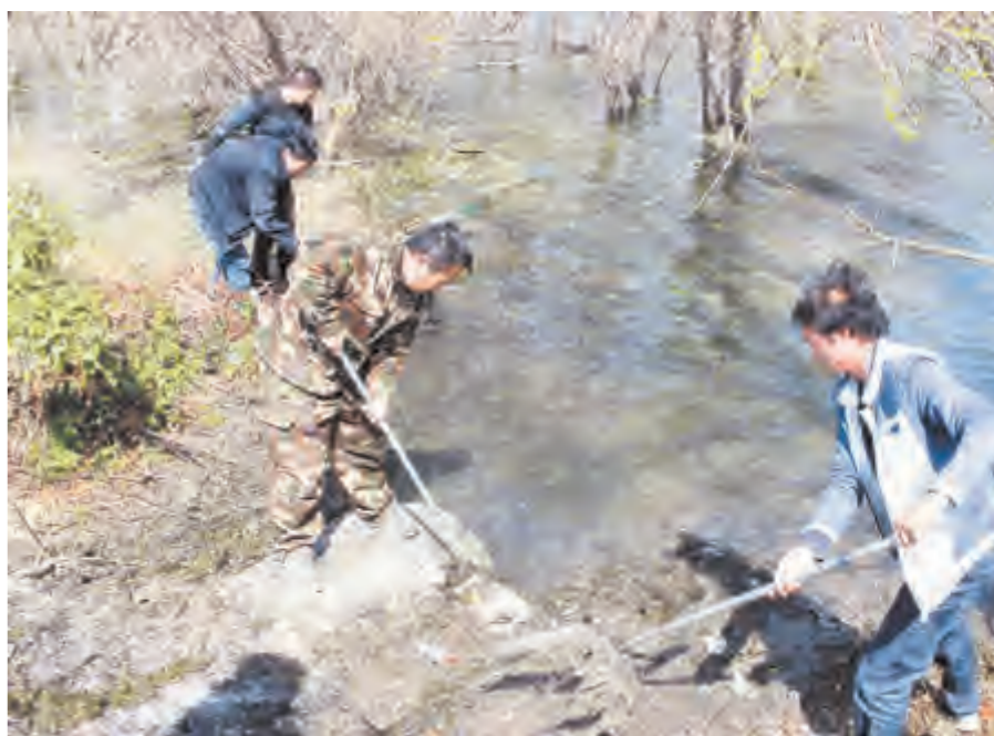
下关镇开展“三清洁”环境卫生整治活动

近日,下关镇组织全镇各村居开展“三清洁”环境卫生整治活动,镇机关干部和村居干部、志愿者以及各挂钩单位的工作人员对全镇辖区内的主要河道、沟渠进行垃圾清理,积极营造一个干净卫生、整洁有序、优美文明的环境。