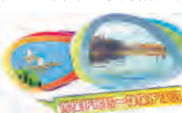
湾桥镇生态水稻种植现场

“水稻是大理地区的传统产业,湾桥镇又是以农业为主的乡镇,‘湾桥米’在大理也小有名气。然而,长期以来,很多村民由于追求高产,过于依赖农药化肥,造成了农业面源污染。因此,湾桥镇积极探索,于2015年3月份引进了云南尚龙米业有限公司发展生态水稻种植,在保护生态环境、控制农业面源污染的同时,改变传统生产