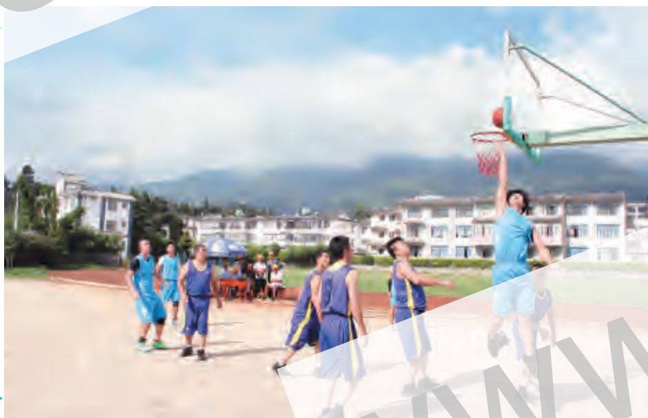
6月23日,大理镇第三届“中和坊酒庄杯”职工篮球赛开赛,来自全镇各单位、村居、企业的12支职工篮球队展开激烈角逐。通过此次比赛活动,达到了强身健体、丰富精神文化生活、激发职工工作热情的目的。