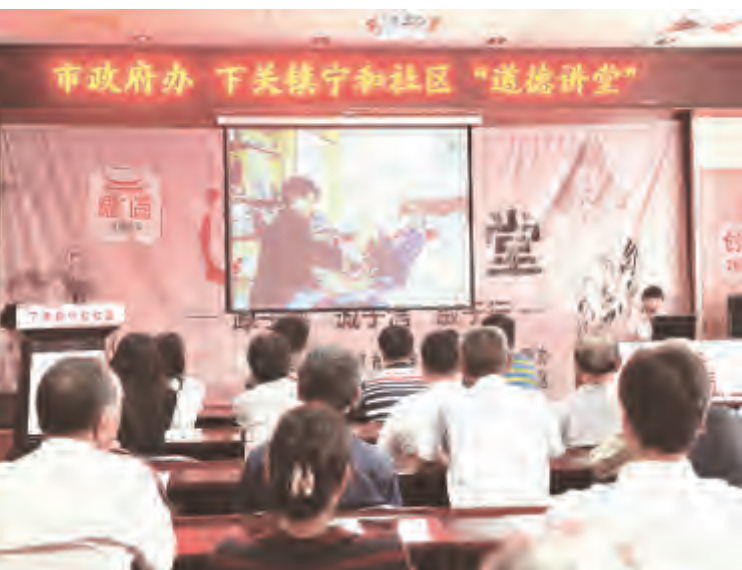
6月25日,市政府办公室与宁和社区联合举办“道德讲堂”活动,讲述身边人身边事,剖析社会主义核心价值观理念,营造良好道德风尚。通过此次活动的举办,提升了干部职工和居民群众的道德素养,同时增强了单位及社区的凝聚力,为深化文明单位和社区建设,营造“崇德尚善”的浓厚氛围奠定了强大的思想道德基础。

2013年以来,鸳浦社区狠抓党建工作,涌现出一批先进党支部、优秀党务工作者和优秀共产党员,发挥了党员的先