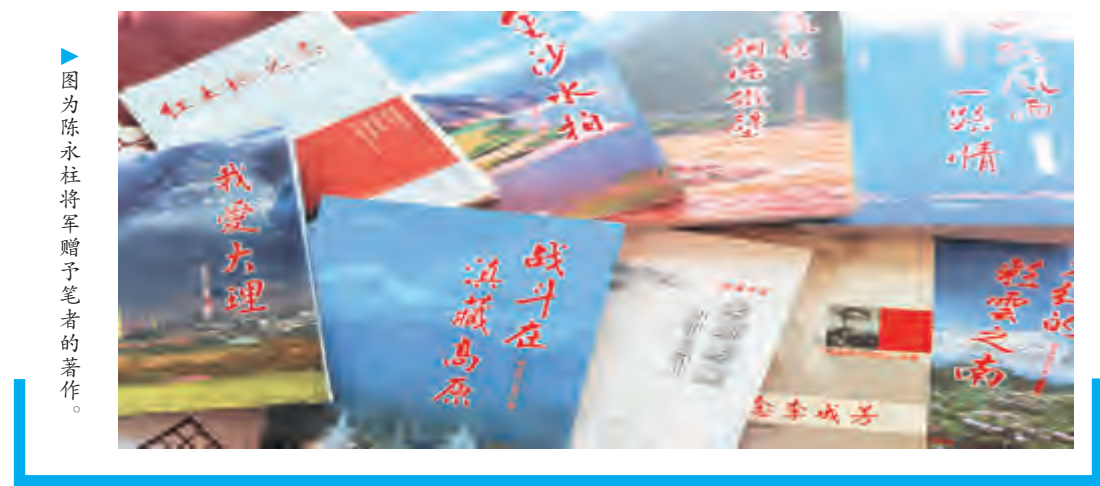
图为陈永柱将军赠予笔者的著作。