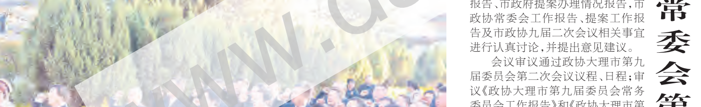
市政协九届常委会第六次会议举行

12月26日，市政协九届常委会第六次会议举行，听取审议相关工作报告，审议通过政协九届二次会议相关事宜。