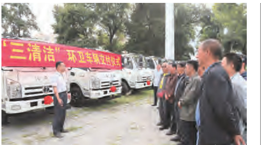
我市一批“三清”环卫车辆交付使用助力洱海保护

代表们表示，学习贯彻落实十九大精神，要以习近平新时代中国特色社会主义思想为指引，牢固树立“四个意识”，切实增强“四个自信”，始终在思想上政治上行动上同以习近平同志为核心的党中央保持高度一致，按照习近平总书记考察云南重要讲话精神要求，主动服务和融入国家发展战略，紧紧围绕建设民族团结进步示范区、生态文明建设排头兵、面向南亚东南亚辐射中心的新目标新定位，大力弘扬“跨越发展、争创一流；比学赶超、奋勇争先”精神，把党的十九大精神落实到各领域、各方面、各战线、各项工作和具体行动中，决战脱贫攻坚、决胜全面小康、实现跨越发展，努力开创跨越式发展和全面从严管党治党新局面，谱写好中国梦的云南篇章。