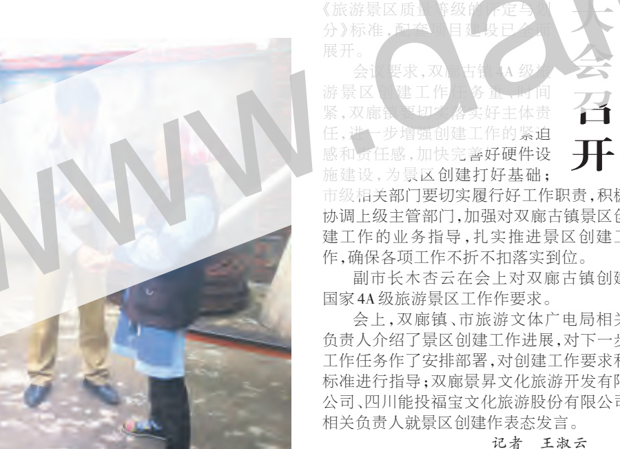
“10·17”扶贫日之际，市财政局领导及驻村干部深入结对帮扶的喜洲镇永兴村村委会和海东镇文笔村85户建档立卡贫困户家中进行“转走访”。