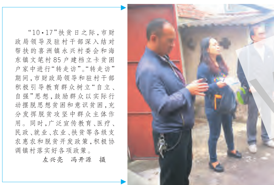
“10·17”扶贫日之际，市财政局领导及驻村干部深入结对帮扶的喜洲镇永兴村村委会和海东镇文笔村85户建档立卡贫困户家中进行“转走访”。

“在精准扶贫工作中，我市认真落实义务教育均衡发展重点乡村发展教育、加强建档立卡贫困户子女职业教育等14条具体帮扶措施，加大项目投入，做到精准建设。”